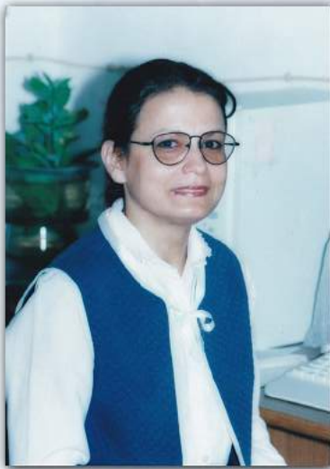
بقلم أ.م.د. عروبة محمد سعيد إبراهيم معاون العميد لشؤون الطلبة والتسجيل

فهذه ضحكتي وهذه ابتساماتي وهذا حيائي وهذا خجلي وهذه دموعي وهذه نفحاتي وهذه أوقات حنيني وهذه مياه فراتي