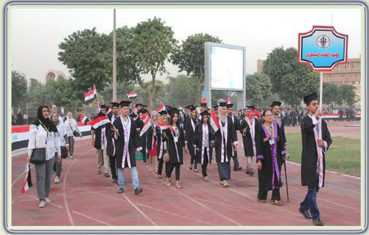
الجامعة تحتفل بتخرج الدورة السادسة والخمسون