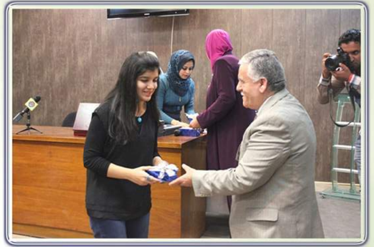
جامعة بغداد تكرم طلبتها الاوائل