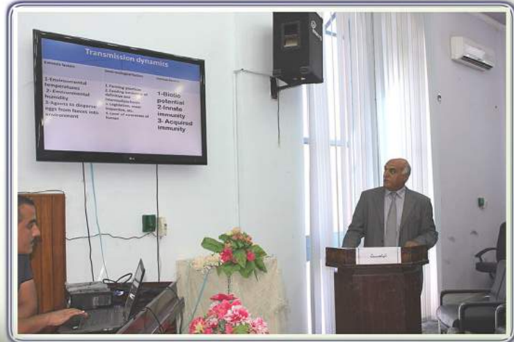
ندوة علمية عن مرض الاكياس اطائية